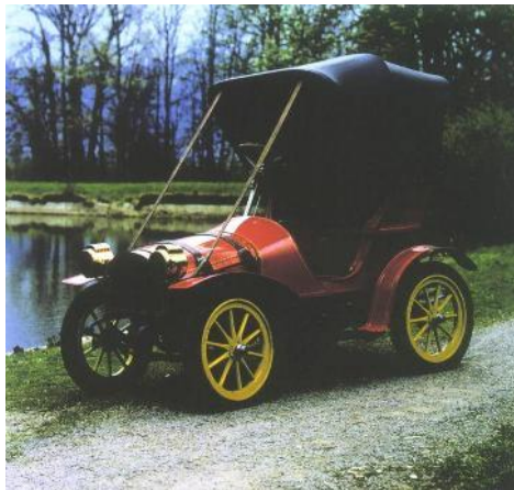
Slika 1: Piccolo iz leta 1906 (Vir: Sitar, 1998, str. 23)

Seminarska naloga je pogosto opremljena s slikami, grafi ali tabelami. Tabele in grafi so posebno značilni za seminarske naloge tehničnega tipa. Slike, tabele in grafi so sredinsko poravnani, pod njimi je njihov opis ter vir, od koder smo povzeli. Slike, tabele in grafikoni so oštevilčeni. Če vir ni naveden, je slika, graf oz. tabela delo avtorja seminarske naloge.