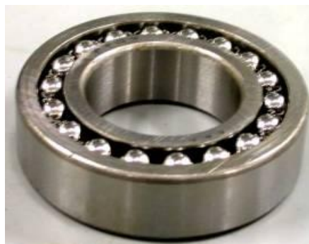
Slika 2: Dvoredni kroglični ležaj